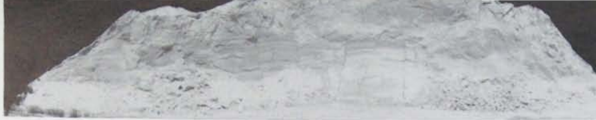
Pierre Charrier Sans titre Photo noir et blanc, sel d'argent sur papier fibres, 1992