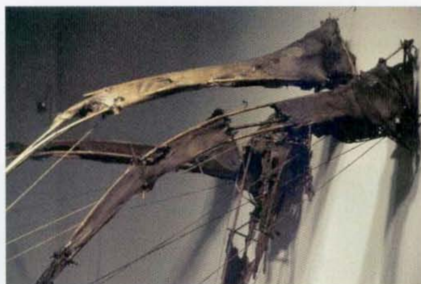
Fragments n° 3,4,5,6 : Détail, Fibre de verre et Bambou, 1989, 1,5 m x 2,14 m x 1,14 m