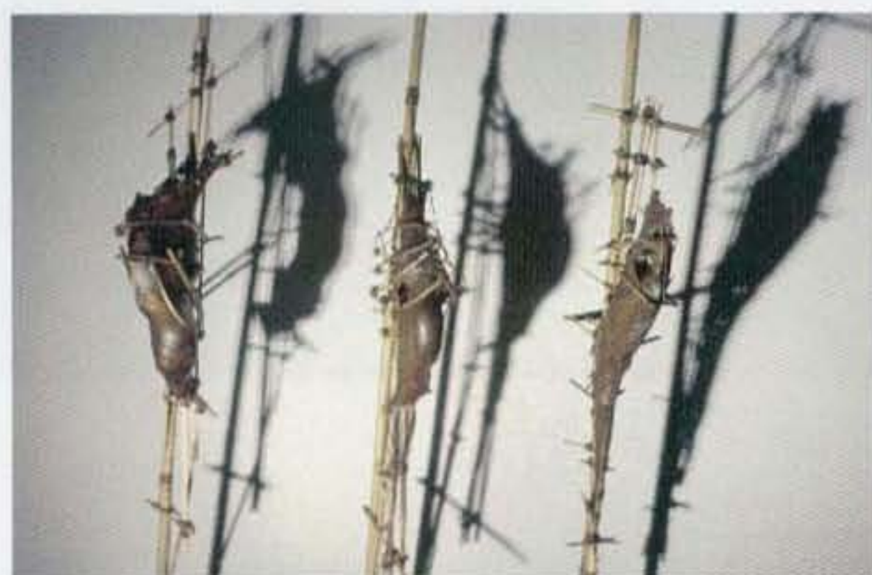
Entraves n° 10, 9, 4 , Trois pièces d'une série de 4, Fibre de verre, Bambou, 1990, 1,22 m x 2 m x 0,58 m