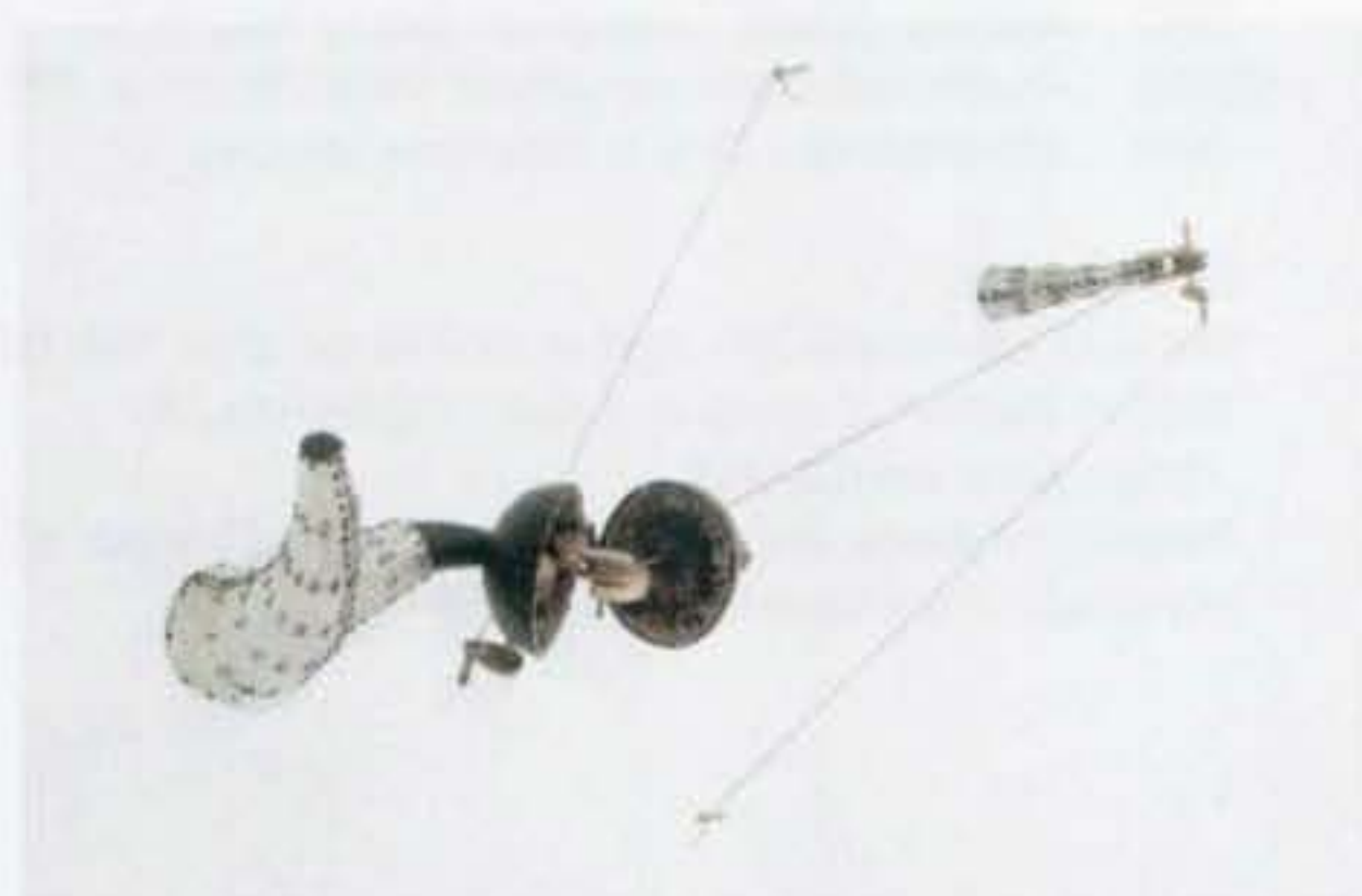
La branche est dans l'arbre n° 2 , Bois, corde, aluminium, cuir, Feutre, cire, visses, 2002/2003, 85 x 145 x 35 cm

Je me préoccupe des apparences, parce que la vérité s'y dissimule. Mes formes sont des apparences qui contiennent une énigme, aussi mystérieuse à moi-même qu'elle peut l'être pour vous ou aussi limpide que la sensation qui s'en dégage. La connaissance que j'ai du monde passe par mon corps. Cette enveloppe de chair qui contient « l'être » est un médiateur essentiel à cette connaissance. Cette enveloppe est le contenant que j'ouvre et entrouvre pour : dévoiler son contenu, laisser deviner ce qui l'habite, me permettre de démonter le mécanisme de la relation à l'autre... si familier et si étranger tour à tour.